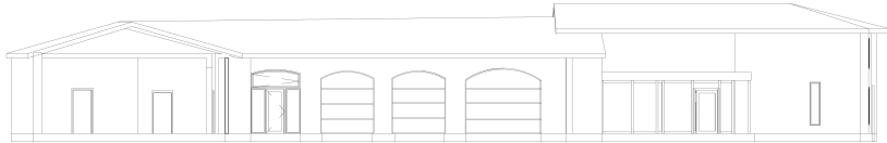
3 Coupe 3 1 : 100