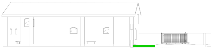
5 Coupe 5 1 : 100